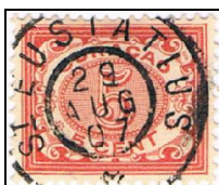
St Eustatius 29 AUG 07