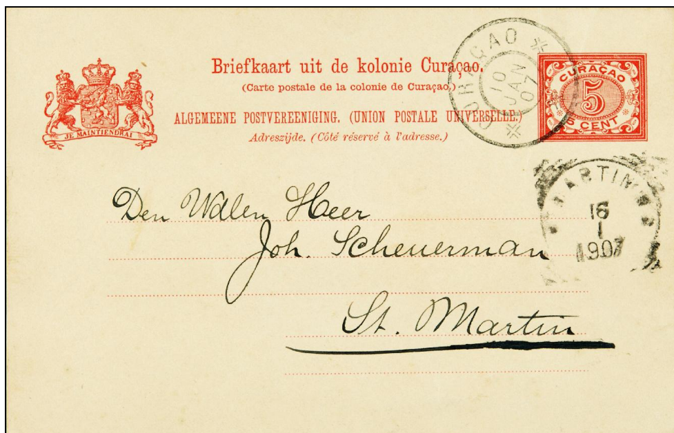
[G19] Curaçao Vbd 10 JAN 07.

De posterijen hebben in ieder geval voor de eilanden Aruba, Bonaire en Saba voor de jaren vanaf 1920 niet voor een datumblok gezorgd. Deze zijn plaatselijk op een provisorische manier aangemaakt.