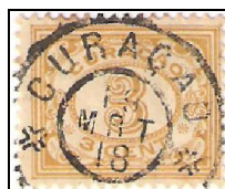
Curaçao 19 MRT 18