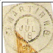
St Martin N.G. 1 JUL 18