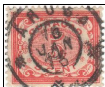
Aruba 10 JAN 15