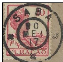
Saba 30 MEI 17