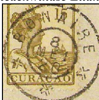
Bonaire 8 MEI 20